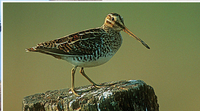
Die Bekassine, ein bedrohter Wiesenvogel

Der Bevölkerung vorgestellt wird dieser wichtige Feuchtlebensraum am 31. Mai, um 18.00 Uhr, im Rahmen der Vorarlberger Umweltwoche.