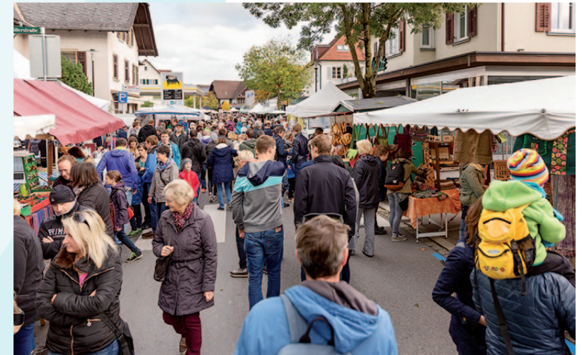
Treffpunkt für Jung und Alt