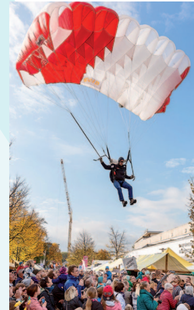
Kilbi-Eröffnung mit Fallschirmsprung